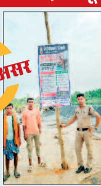
खबर का असर